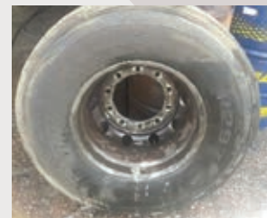
Antes de la limpieza