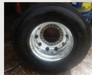
Después de la limpieza